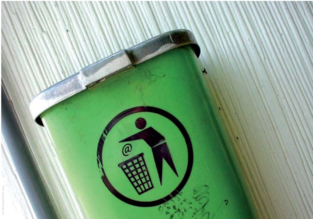
Deutsche Leitmedien bekommen pro Tag Tausende von Pressemitteilungen. Ein großer Teil davon landet im virtuellen Papierkorb.